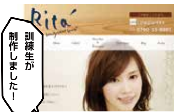
WEB サイト制作 神崎郡神河町 Rita' 様 http://rita.webcrow.jp/

姫路周辺のWEB・アパレル関連企業などでサイト作成・リニューアルの実習を行います。